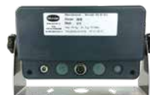
VISTA POSTERIORE (VERSIONE OMOLOGATA)