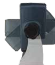
SUPPORTO REGOLABILE IN ACCIAIO INOX