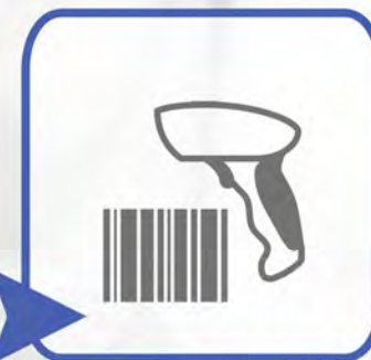
COLLEGAMENTO A SCANNER