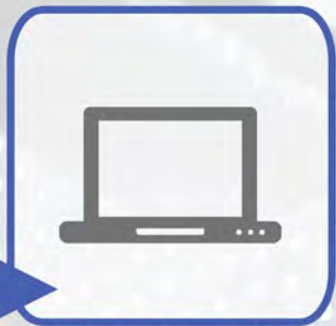
COLLEGAMENTO A PC