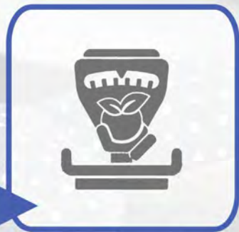
COLLEGAMENTO BILANCE PER VENDITA A REPARTO E CHECK-OUT