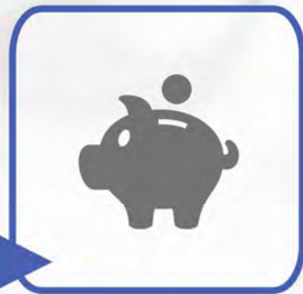
COLLEGAMENTO A MODEM PER L'EROGAZIONE DEI SERVIZI IO-CONTO